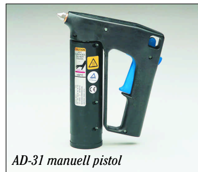
AD-31 manuell pistol