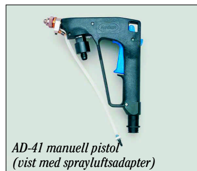
AD-41 manuell pistol (vist med sprayluftsadapter)